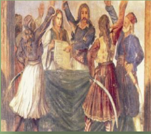
Το πρώτο Σύνταγμα της Επιδαύρου

Αποτελούνταν από 110 σύντομες παραγράφους, οι οποίες υποδιαιρούνταν σε «τίτλους» και «εδάφια», κατά το γαλλικό πρότυπο. Οι συντάκτες του επέλεξαν τον τίτλο «Προσωρινό Πολίτευμα της Ελλάδος», επειδή φοβούνταν πιθανή αντίδραση της Ιεράς Συμμαχίας απέναντι σε ριζοσπαστικές πολιτικές εξελίξεις. Περιείχε λίγες διατάξεις σχετικές με την προστασία των θεμελιωδών δικαιωμάτων , ενώ σε ότι αφορά στο οργανωτικό μέρος, καθιέρωνε την αντιπροσωπευτική αρχή , καθώς επίσης και την αρχή της διάκρισης των εξουσιών . Η Διοίκηση ασκείται από 2 σώματα «Βουλευτικό» και το «Εκτελεστικό».