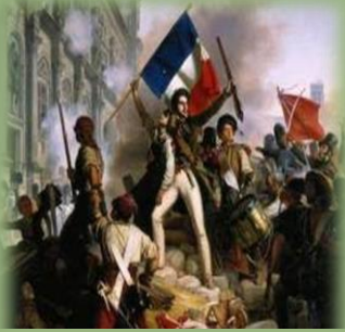
Η πτώση της Βασιλίας