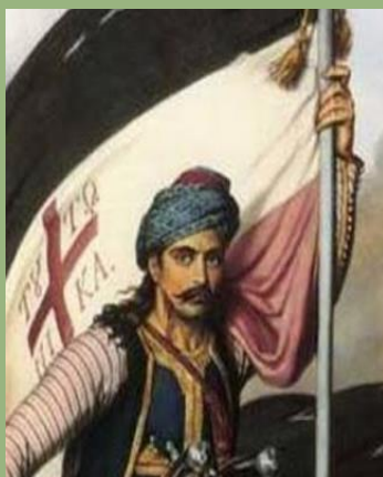
Νικηταράς ο Τουρκοφάγος