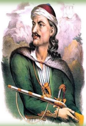
Ο Οδυσσέας Ανδρούτσος