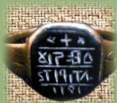
Το δακτυλίδι με τις λέξεις ΔΙΣΣΕΑ ΑΝΔΡΟΥΤΣΟ.

Ο πρώην σύντροφός του Γιάννης Γκούρας έμαθε ότι η κυβέρνηση σχεδιάζει να του δώσει αμνηστία και να τον επαναφέρει στο στράτευμα, ακόμα και σε ηγετική θέση. Ο Γκούρας έτρεμε αυτήν την προοπτική. Αν έβγαινε ο Οδυσσέας από τη φυλακή δεν υπήρχε περίπτωση να μην εκδικηθεί τον παλιό σύντρόφό του που τον είχε προδώσει. Επιπλέον, ο Γκούρας θα έχανε την πολιτική δύναμη που είχε. Έτσι, μετά από μια αποτυχημένη προσπάθεια να πείσει την κυβέρνηση να τον εκτελέσει για εσχάτη προδοσία, έστειλε αμέσως εντολή να δολοφονηθεί ο Οδυσσέας. Έχει ενδιαφέρον το σύνθημα που είχαν συμφωνήσει: