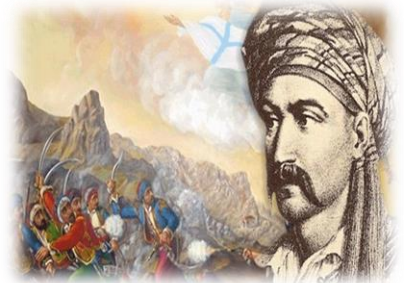
Νικηταράς ο Τουρκοφάγος