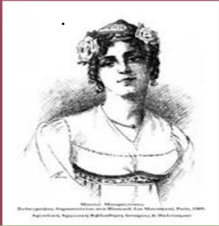
Blancard, Les Mavroyeni , ξύλογραφία, Paris 1909.

Δεν έχει σημασία τι θ' απογίνω εγώ αρκεί να ελευθερωθεί η πατρίδα μου.