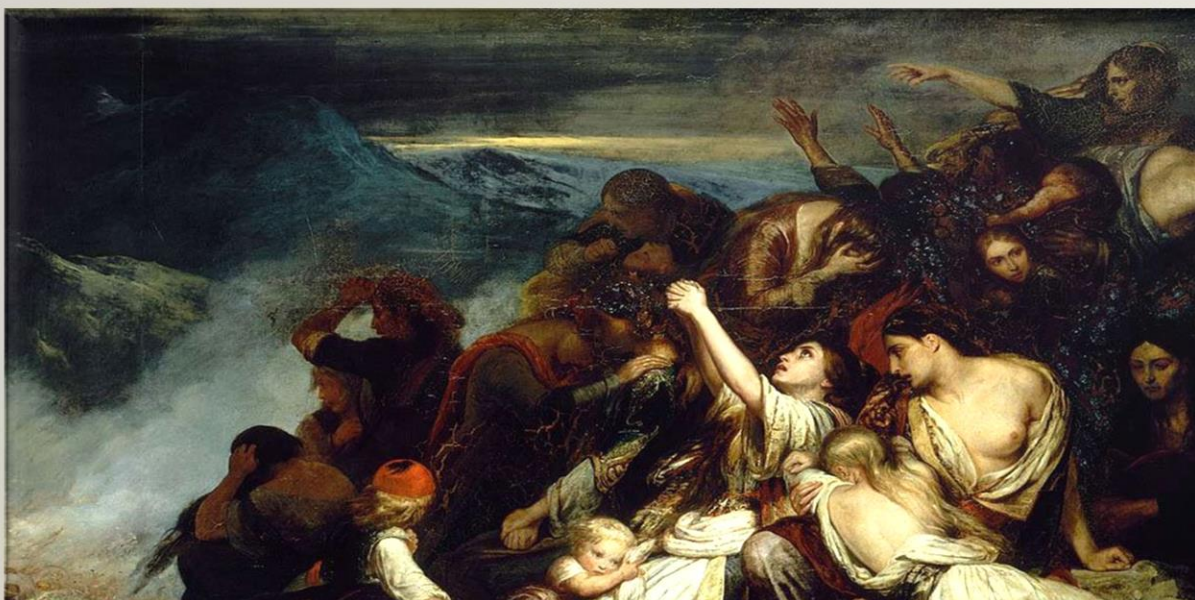
Ary Scheffer, Les femmes souliotes (Οι Σουλιώτισσες), 1827. Μουσείο του Λούβρου.