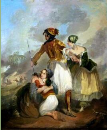
Άρι Σέφερ: Πολεμιστής φυγαδεύει αμάχους