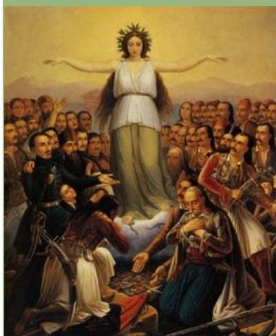
Θεόδωρος Βρυζάκης: Η Ελλάδα ευγνωμονούσα