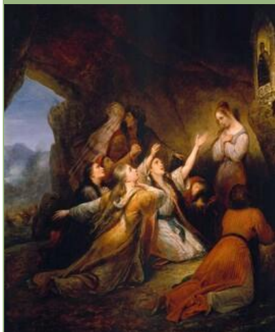
Άρι Σέφερ: Έλληνίδες εκκλιπαρώντας για βοήθεια