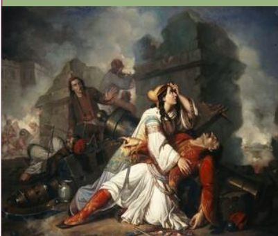
Ντονάτο Φραντσέσκο Ντε Βίβο: Ο θάνατος του Λάμπρου Τζαβέλλα