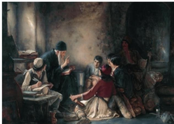
Κρυφό σχολειό, Νικόλαος Τύζης

Από τον Λόρδο Byron μέχρι τον Delacroix, πολλοί ήταν οι γνωστοί καλλιτέχνες της εποχής, που εμπνεύστηκαν, παρακίνησαν, αλλά και σόκαραν τους Ευρωπαίους με τα έργα τους για την Επανάσταση του 1821