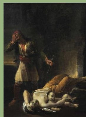
Έλληνας Αγωνιστής θρηνεί τη νεκρή γυναίκα και το παιδί του, Αγνώστου, Γαλλικής σχολής, γύρω στο 1830, Λάδι σε μουσαμά, 33 X 25 εκ., Συλλογή Μιχάλη και Δήμητρας Βαρκαράκη